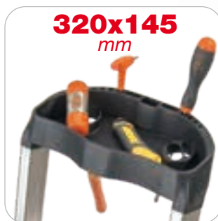
Porta utensili e presa della mano

La doppia inclinazione significa strategica aderenza al punto di lavoro