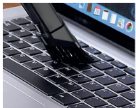
Minispazzola Mini Brush

DC 7,4V - 8,4V | 2500 mAh x 2 | 21X9 CM | H 26 CM