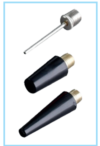
3 ugelli di gonfiaggio 3 inflate nozzles

DC 7,4V - 8,4V | 2500 mAh x 2 | 21X9 CM | H 26 CM