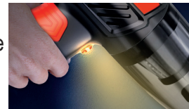
Luce led ad alta luminosità High-Brightness LED Light