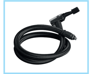
Tubo di gonfiaggio dell'aria Air Inflate Hose