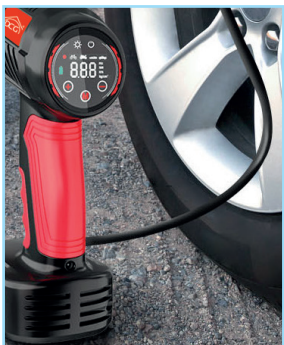
Manometro led per pneumatici LED Tire Pressure Gauge