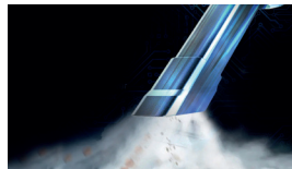
Forte aspirazione Strong suction