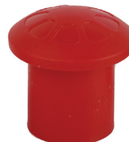
MODELLO PER TONDINO 16-32MM

Materiale: Polietilene Material: Polyethylene Matériel: Polyéthylène