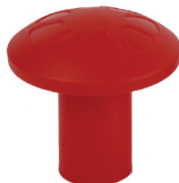
MODELLO PER TONDINO 6-20MM

Produit par GRUPPO STAMPLAST en polyéthylène c'est un accessoire indispensable dans la signalation de moignons des barres de fer proéminent. Cet article est disponible en quatre versions, pour le marché italien et étranger.